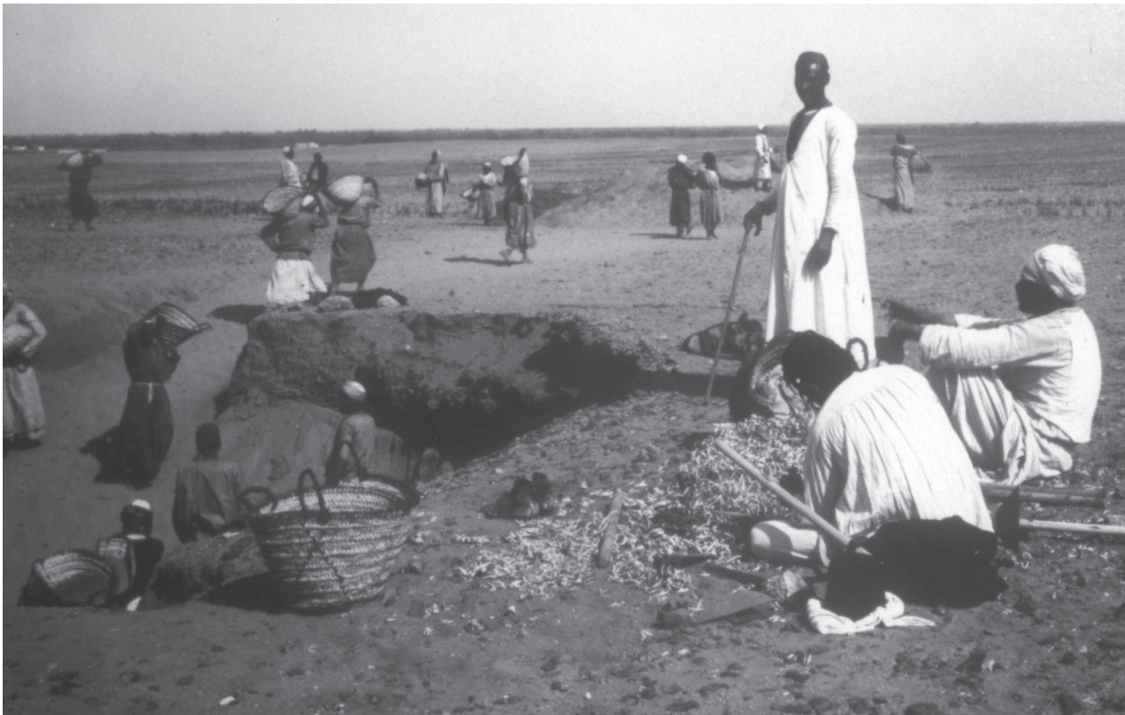
Fig. 3. Belgische opgravingen te Heliopolis, 1907.