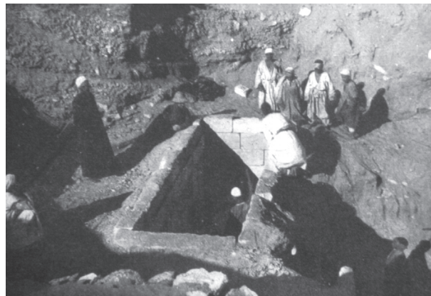
Fig. 2. Saqqara, 1905-1906. Vrijleggen van de mastaba van Neferirtenef.