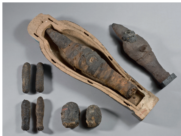
Fig.4. Brussel, Koninklijke Musea voor Kunst en Geschiedenis. Objecten afkomstig van de Belgische opgravingen te Sheikh Fadl.

Gelatenheid? Opgave? Niets van dit alles, want in december 1923 onderneemt de ESKE – in het geheim weliswaar – een eerste opgravingscampagne waarbij de streek van Sheikh Fadl (Midden-Egypte) onderzocht wordt. Volgens bedoeïenen bevinden zich hier de resten van het graf van een zekere “koning Batlos uit de Romeinse tijd” (overigens volslagen onbekend!) en een ondergrondse begraafplaats die een veertigtal graven van prinses en priesters uit de 1 ste tot de 9 de dynastie zouden moeten bevatten. In januari 1924 geeft de Service des Antiquités de l’Egypte (SAE) via Pierre Lacau, de opvolger van Maspero, de officiële toestemming voor de opgravingen. Capart neemt daarop koningin Elisabeth in vertrouwen: “ik durf me niet laten verleiden tot grote dromen, maar de situatie ziet er veelbelovend uit (...). Ik heb er vertrouwen in want ik heb de indruk dat het mooie sprookje dat een jaar geleden begon nog enkele nieuwe ontwikkelingen in petto heeft die gunstig zijn voor de Musea en de Belgische wetenschap.” Aangezien hij zelf Brussel niet kon verlaten, vaardigt hij zijn assistente Marcelle Werbrouck af naar Sheikh Fadl. Zij wordt kort daarop vergezeld door Henri Naus Bey, voorzitter van de ESKE en directeur-generaal