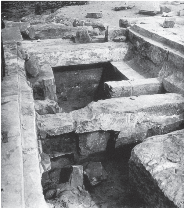
Fig. 9. Elkab, 1937. Crypte A onder het heiligdom van Nechbet.

In januari 1938 gaat in Elkab, nog steeds onder de leiding van Jean Capart, een tweede campagne van start. Het team is licht gewijzigd en geniet opnieuw de financiële steun (25.000 BF) van de Belgische overheid.