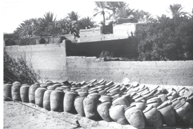
Fig. 5. Belgische opgravingen te Tell Heoe, 1927: de kruiken.

Van 14 tot 20 februari 1927 onderzoeken Capart, Werbrouck, van de Walle en een twintigtal arbeiders in de Libische woestijn de resten van een kapel die is opgedragen aan Osiris Ibis: de vloerbedekking, versierde blokken waarop een processie van beschermgoden en libatiescènes is afgebeeld en fragmenten van registers met offerandeformules. Ze onderzoeken ook een graf dat in de rotsen is uitgehouwen en ontdekken daar een 200-tal grote vazen die gevuld zijn met mummies van ibissen en andere roofvogels. Proefopgravingen op een aangrenzend plateau leveren een graf uit het Middenrijk op waarin ze een halsketting van geëmailleerde parels, versierd met een zegel in de vorm van een kikker en enkele objecten uit gebakken klei vinden. Bij de verdeling van de oudheden behoudt de SAE de halsketting en twee figurines. De ESKE ontvangt zes figurines en twee offerandeobjecten. De oogst is niet erg groot. Dat weerhoudt Jean Capart er echter niet van om de pers op de hoogte te brengen: “voor de eerste maal zijn de Belgen erin geslaagd de collecties van het grote museum in Cairo te verrijken. Daarom zijn de opgravingen te Tell Heoe een mijlpaal in de geschiedenis van de Belgische egyptologie.” Een negatieve kanttekening: de Egypt Exploration Society stelde het niet erg op prijs dat de ESKE ook begon op te graven. “Onze Engelse vrienden vergissen zich wanneer ze onze Stichting als een concurrent beschouwen,” repliceert Jean Capart wanneer hij zich naar Londen begeeft om