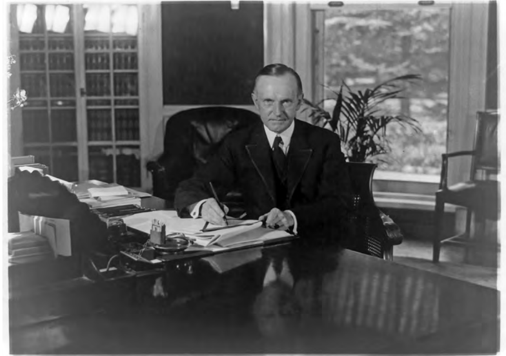
President Coolidge in het Oval Office, 1923.

Op 4 november 1924 was Jean Capart aanwezig op Election Day, toen de republikeinse kandidaat John Calvin Coolidge triomfantelijk werd herverkozen tot president van de Verenigde Staten. Twee-en-een-halve maand later, op 22 januari 1925, toen hij in Washington D.C. verbleef, nodigde Coolidge Capart uit op het Witte Huis, samen met de Belgische ambassadeur, baron Emile de Cartier de Marchienne. Na enkel minuten wachten in een antichambre werden ze binnengeleid in een kantoor waarvan de vorm hem verraste: het was ovaal. In zijn Journal de voyage beschrijft Capart zijn ontmoeting met de 30 e president van de Verenigde Staten als volgt: En dan gaat de deur open en betreed ik, na de Ambassadeur, een rotonde met daarin de bureaus van Coolidge. Op de hoek van de tafel prijkt een grote Amerikaanse vlag. De President ontvangt ons zonder veel omhaal en ernstig: hij is