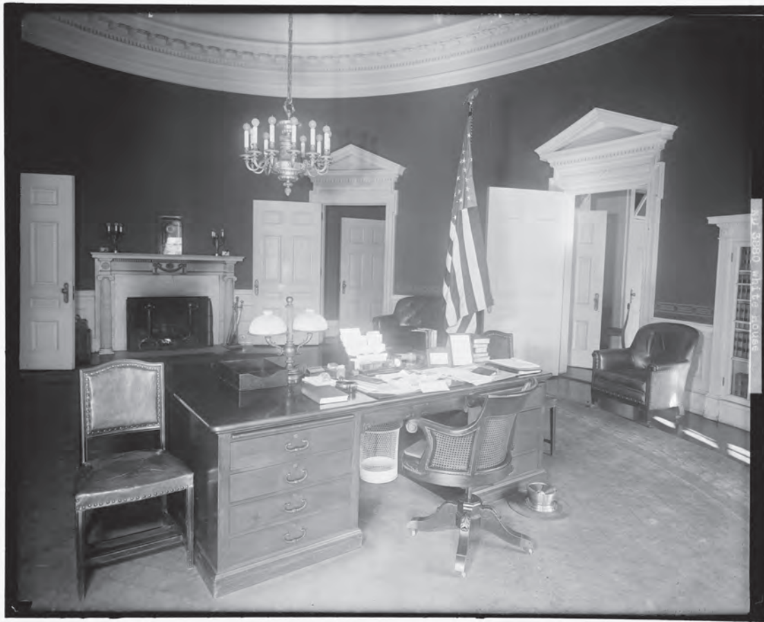
Oval Office, ca. 1925.