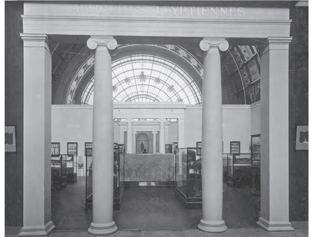
Jubelparkmuseum, Brussel. De Egyptische zalen aan het begin van de 20e eeuw.

Vanaf 1896 verrichtte de Franse archeoloog Albert Gayet (1856-1916) opgravingen op de site van Antinoëpolis, gedeeltelijk in opdracht van Emile Guimet, oprichter van