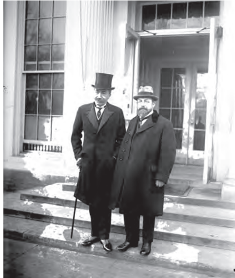
Baron de Cartier de Marchienne, Belgisch ambassadeur, en doctor Jean Capart aan de uitgang van het Witte Huis, 22 januari 1925.