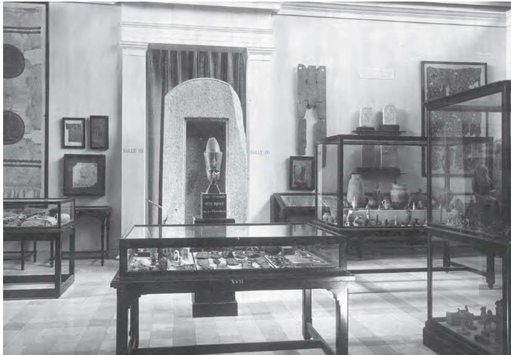
Jubelparkmuseum, Brussel. De Egyptische zalen aan het begin van de 20e eeuw.

De Egyptische antiquiteiten die in Abydos waren ontdekt door de Franse archeoloog Emile Amélineau (1850-1915) werden op 8 en 9 februari 1904 in Parijs geveild. Deze objecten waren gevonden tijdens diens opgravingen in de koninklijke necropool van de eerste dynastieën, op de site van Umm el-Qaab. Capart kon een vijftigtal objecten van deze collectie kopen, waaronder de stèle van koning Den uit de 1e dynastie, en een groot aantal vazen en andere objecten uit de Vroeg-dynastieke Periode aankopen die zijn belangstelling illustreren voor de periode waarin de Egyptische beschaving tot ontwikkeling kwam.